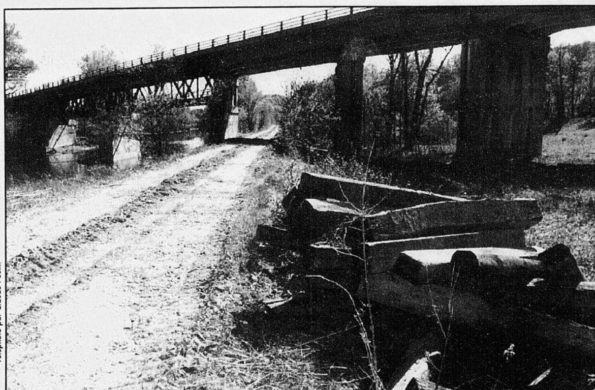
D'ici deux semaines, après l'enlèvement des rails et dormants sur le tronçon de Lennoxville de la vieille ligne du CP se rendant à Beebe, les aménagements d'une piste cyclable pourront être entrepris.

À tout événement, pour le président du groupe qui a initié cette action pan-régionale visant la réutilisation à des fins récréatives et touristiques des voies ferrées désaffectées, c'est un défi considérable qui se pointe à l'horizon: de par