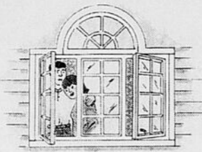
BEAUCOUP DE STYLES