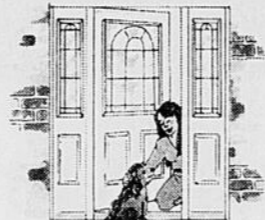
BEAUCOUP DE QUALITÉ